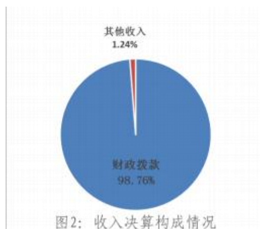
图2: 收入决算构成情况

本单位 2020 年度本年收入合计 76.62 万元,其中: 财政拨款收入 75.67 万元,占 98.76%; 事业收入 0 万元,占 0%; 经营收入 0 万元,占 0%; 其他收入 0.95 万元,占 1.24%。如图所示: