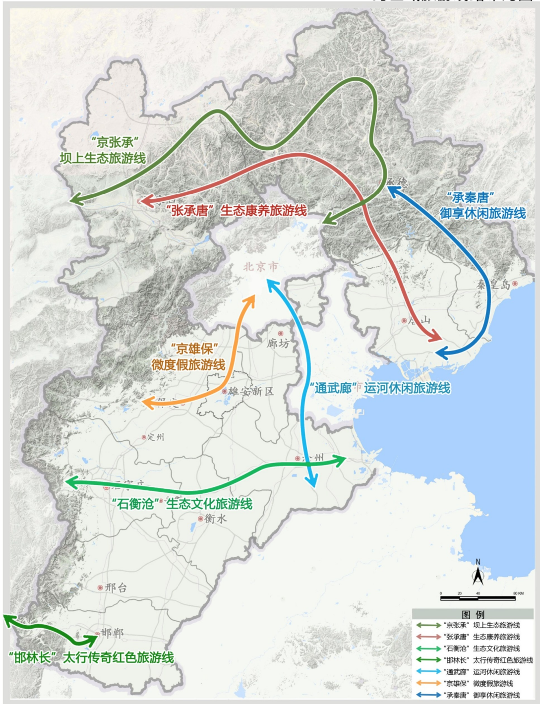
跨区域旅游线路布局图